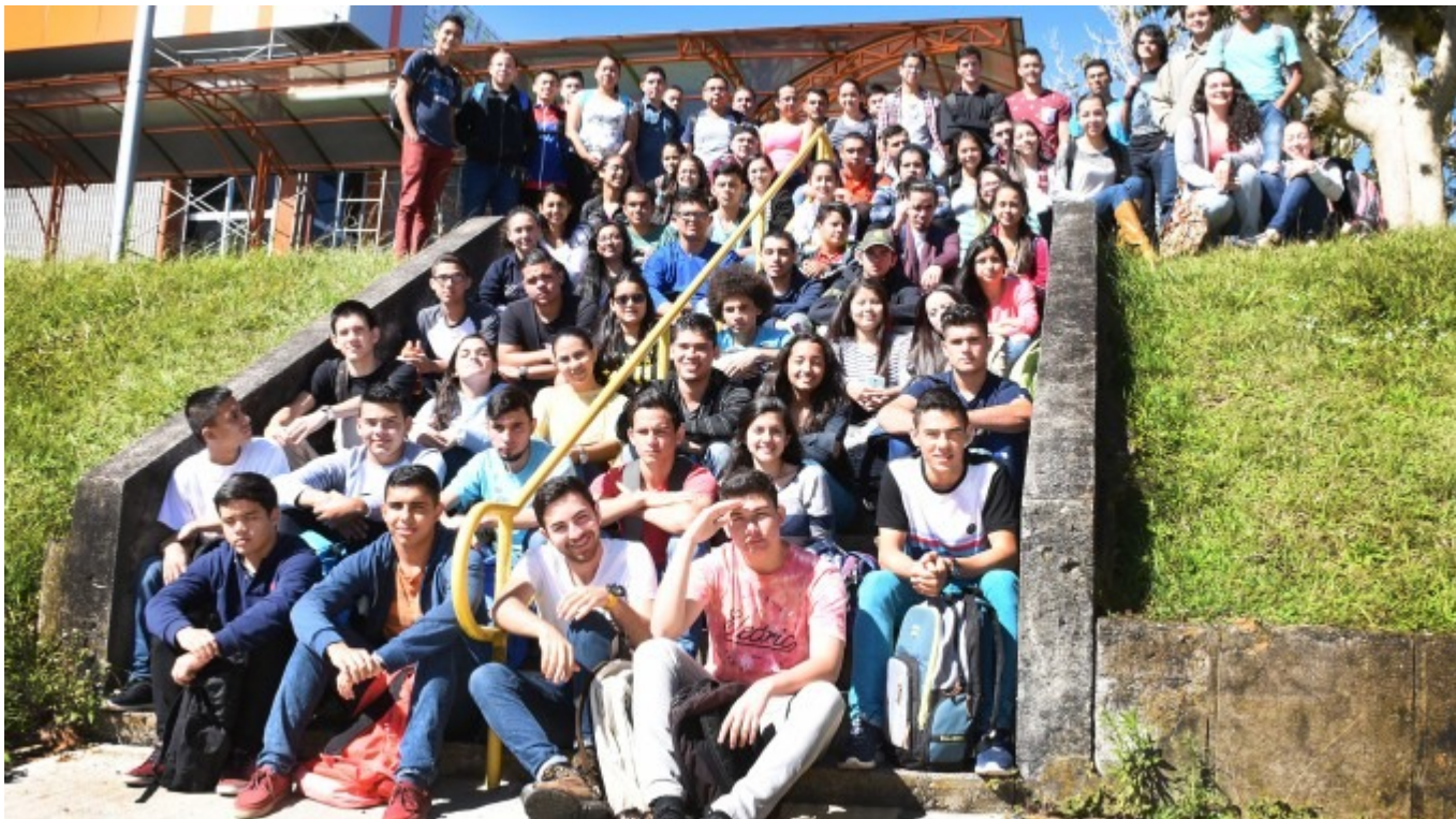
Jóvenes estudiantes partícipes de la Generación No. 12 del Programa de Admisión Restringida (PAR).