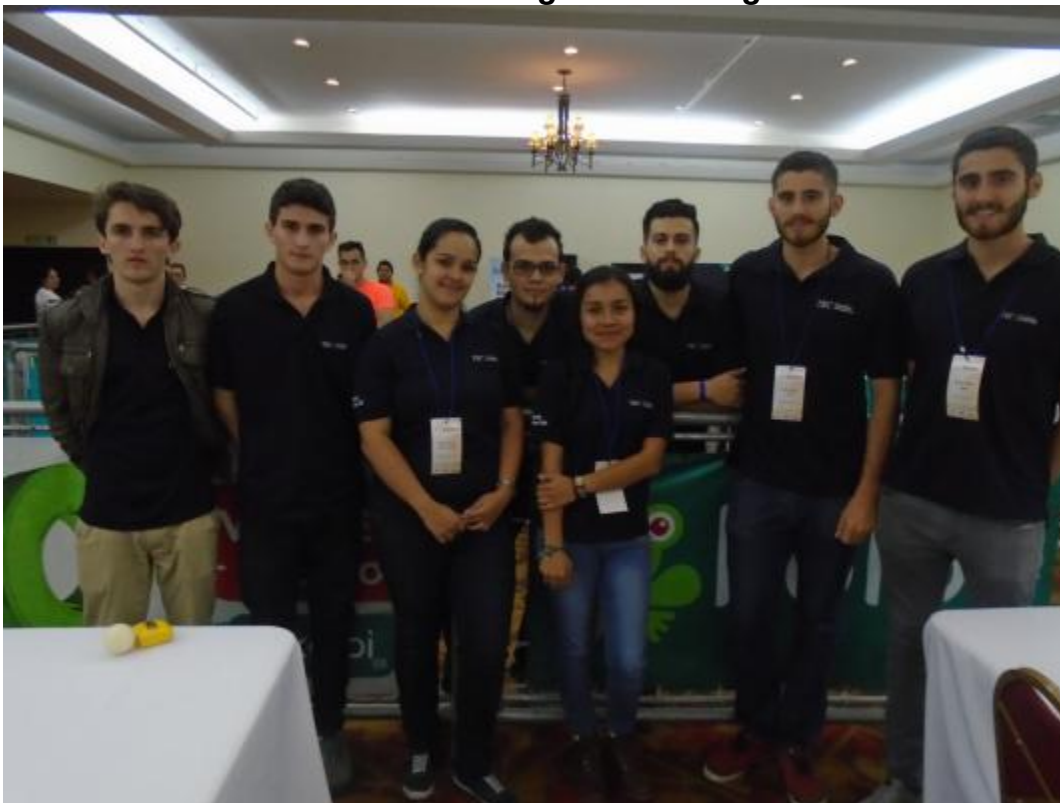
Estudiantes de diversas carreras del TEC participaron en la competencia realizada en el Hotel Wyndhan.