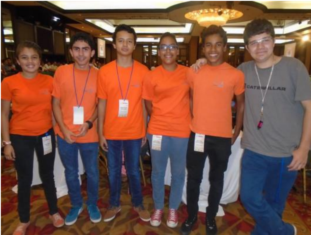
Miembros de la delegación B y C de ACB Mecatrónica.