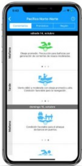
App MIO CIMAR 2015-2018