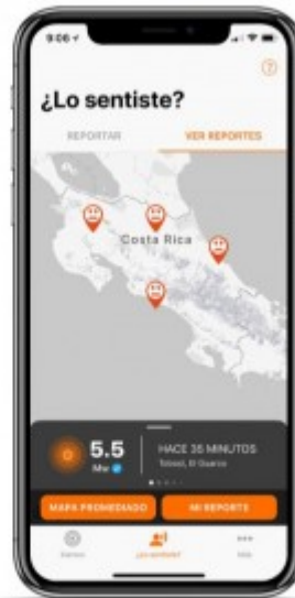
App RSN Mayo 2018