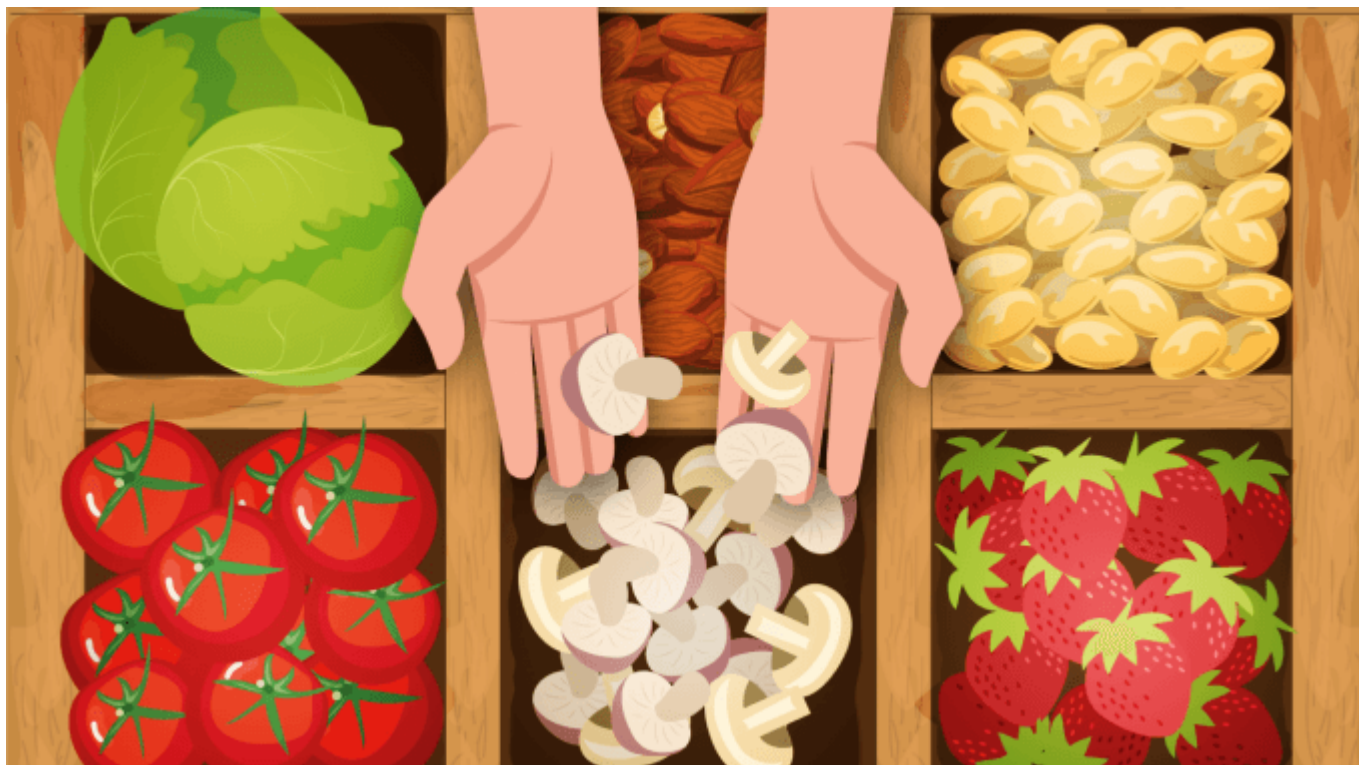
Imagen con fines ilustrativos. Anthony Morera/OCM