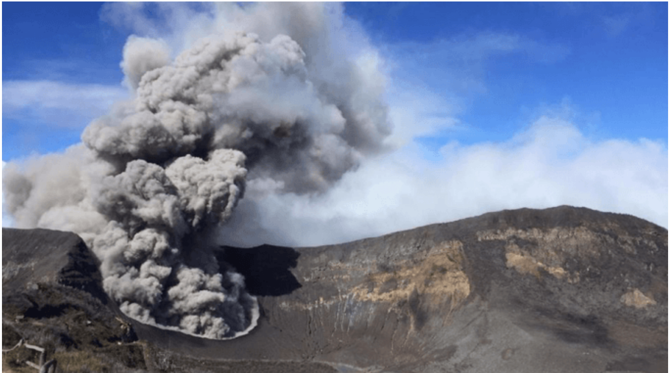
Fotografía del volcán Turrialba. Tomada el 28 de noviembre de 2018 por la guardaparque Reina Sánchez.