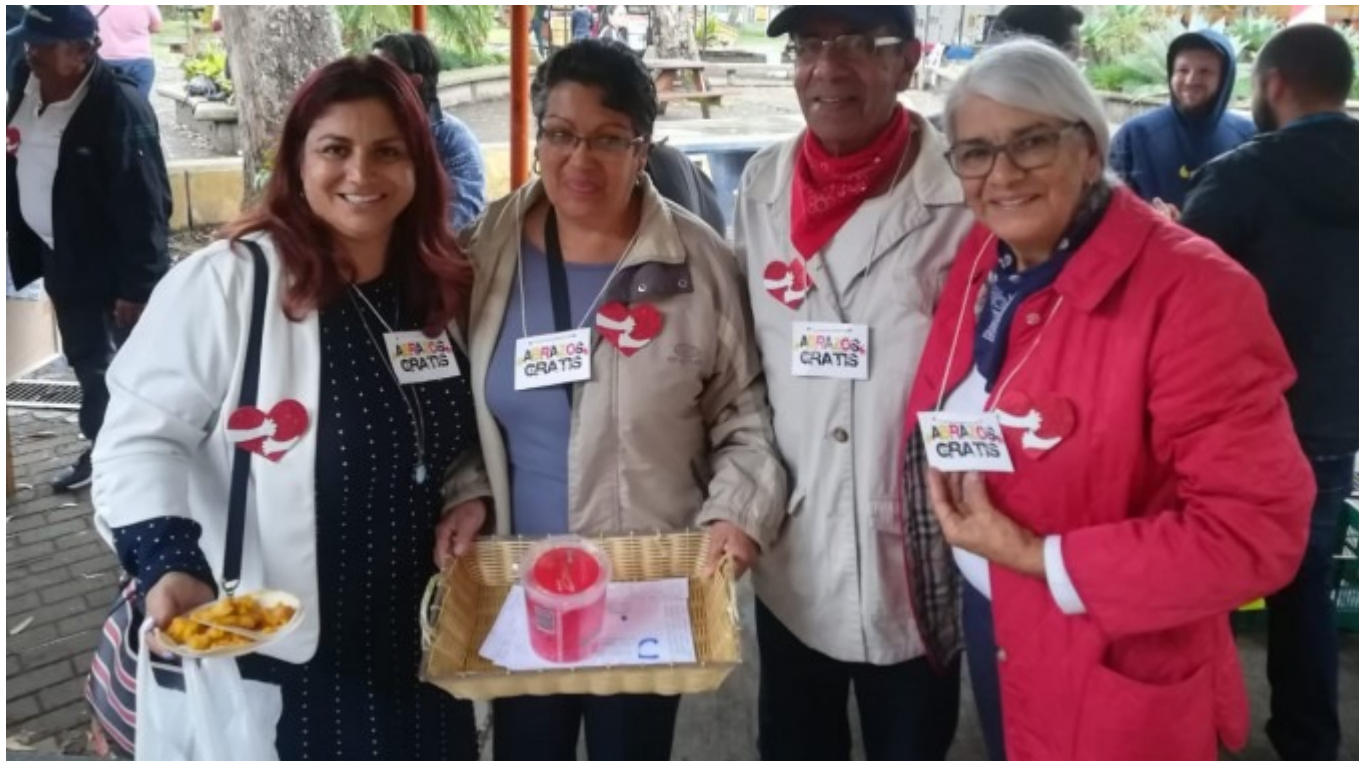
Parte de las personas que participaron en la dinámica de dar abrazos