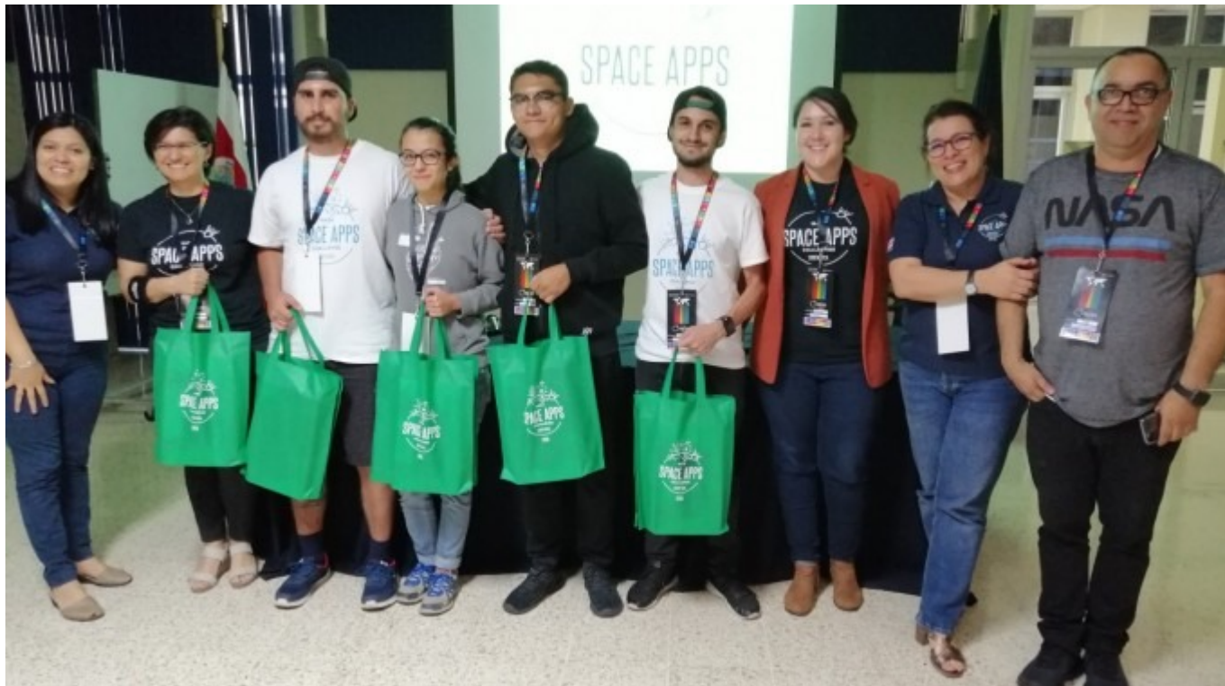
Ganadores del NASA International Space Apps Challenge 2019.