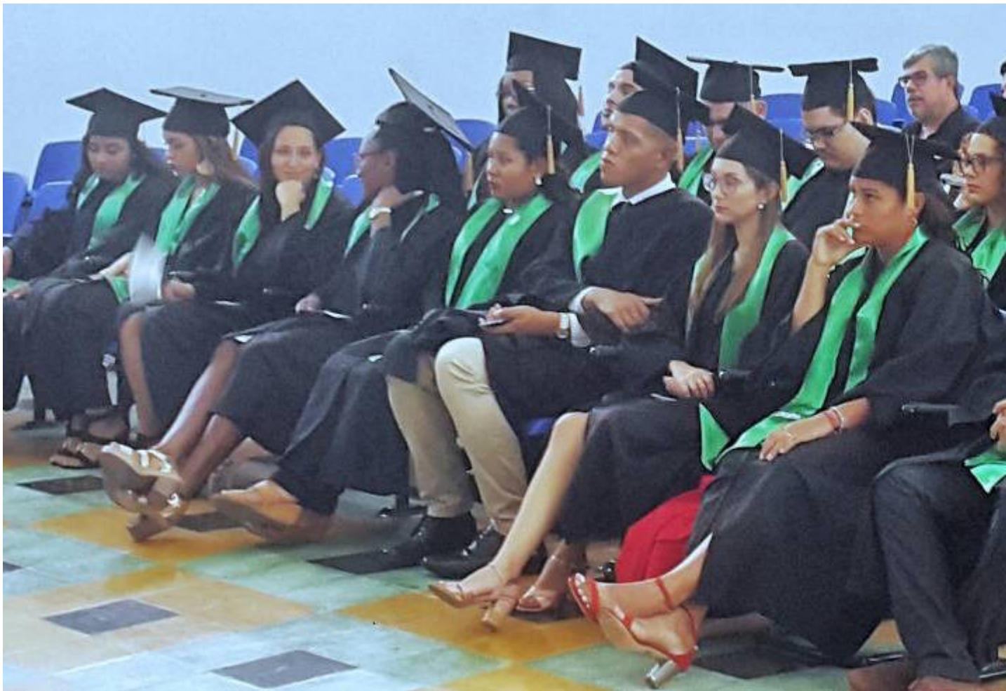
En total, 17 nuevos profesionales recibieron su título este mes.

El TEC llegó a 42 nuevos graduados este mes de octubre, cuando en un acto solemne, la Institución graduó 17 nuevos profesionales. De manera específica, ocho ingenieros en Computación, ocho Administradores de Empresas y un nuevo ingeniero en Producción Industrial.