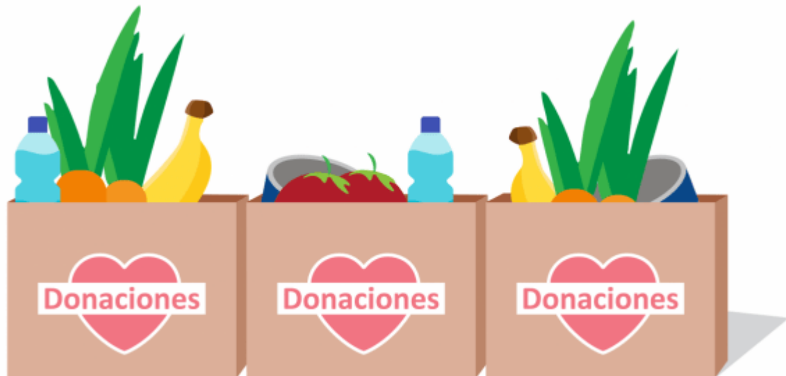
Imagen con fines ilustrativas. Diseño elaborado por Nicole De Vries / TEC.