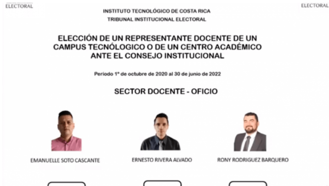
Imagen de la papeleta para el sector Docente-Oficio en las próximas elecciones del Consejo Institucional, según el acomodo que se sorteó durante la entrega de las procedencias. Captura de pantalla de transmisión en vivo de la sesión.

Tecnológico celebró, por primera vez, un evento protocolario de manera telepresencial