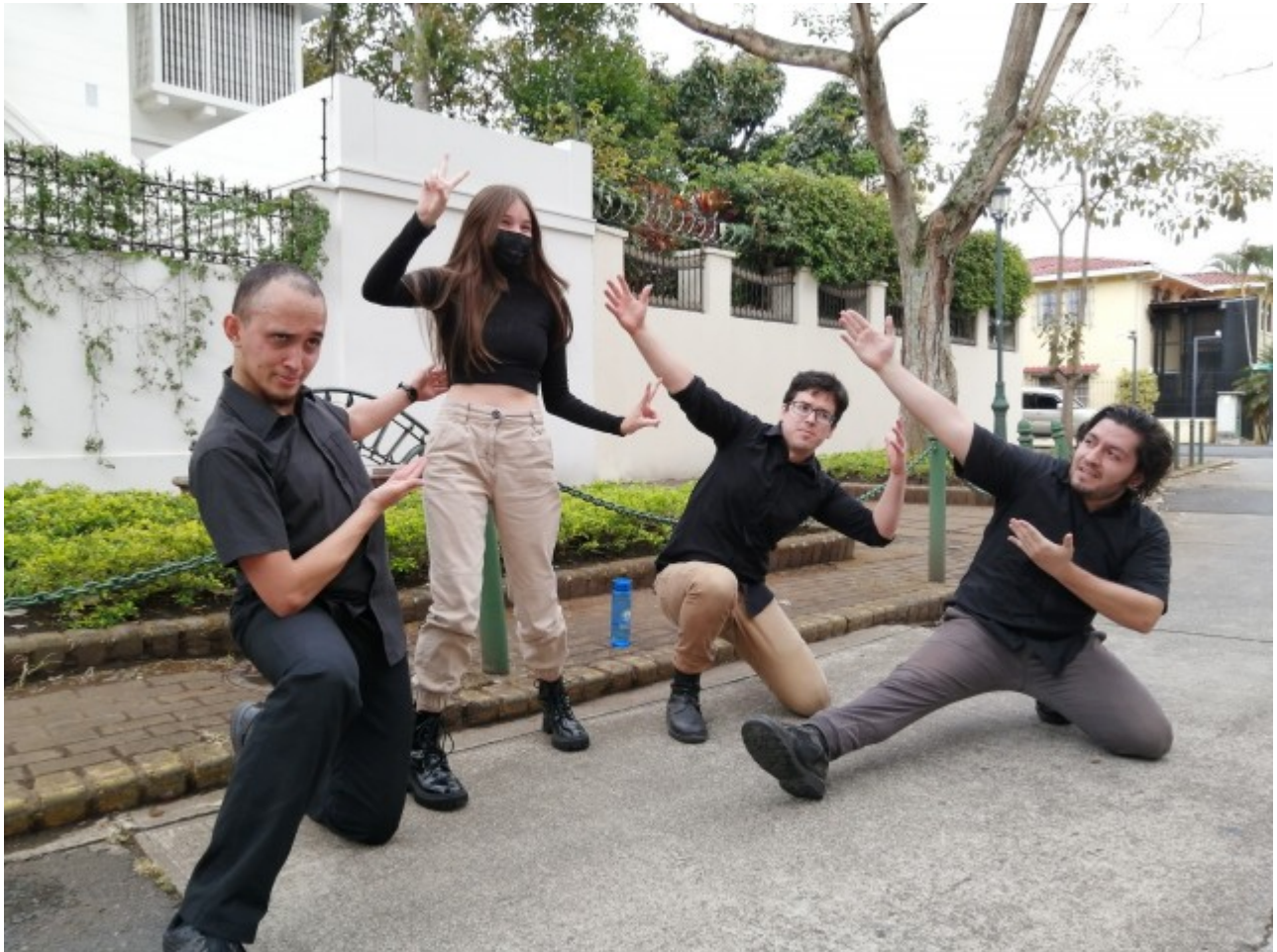
'El socollón de la abuela' fue el título escogido para la obra que el Teatro Interruptor creó en el mismo momento de presentación.

“El artista es muy emotivo y necesita crear. Para un artista, crear es como el alimento del alma. Esto nos ha alimentado el alma como artistas y como seres humanos. Después de crear y de tener contacto con el público en este festival volvemos a la casa muy entusiasmados y meditando en todo lo que la pandemia nos había quitado y ahora se valora más. Igual que la pandemia nos dejó enseñanzas de lo que teníamos que valorar dentro de la casa. Tenemos que ser mejores personas ahora”, subrayó Bakit.