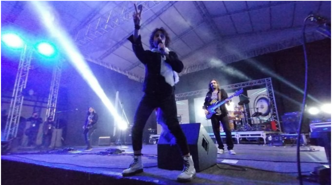
La agrupación Gandhi tuvo a cargo el concierto de cierre del festival Amón Cultural.