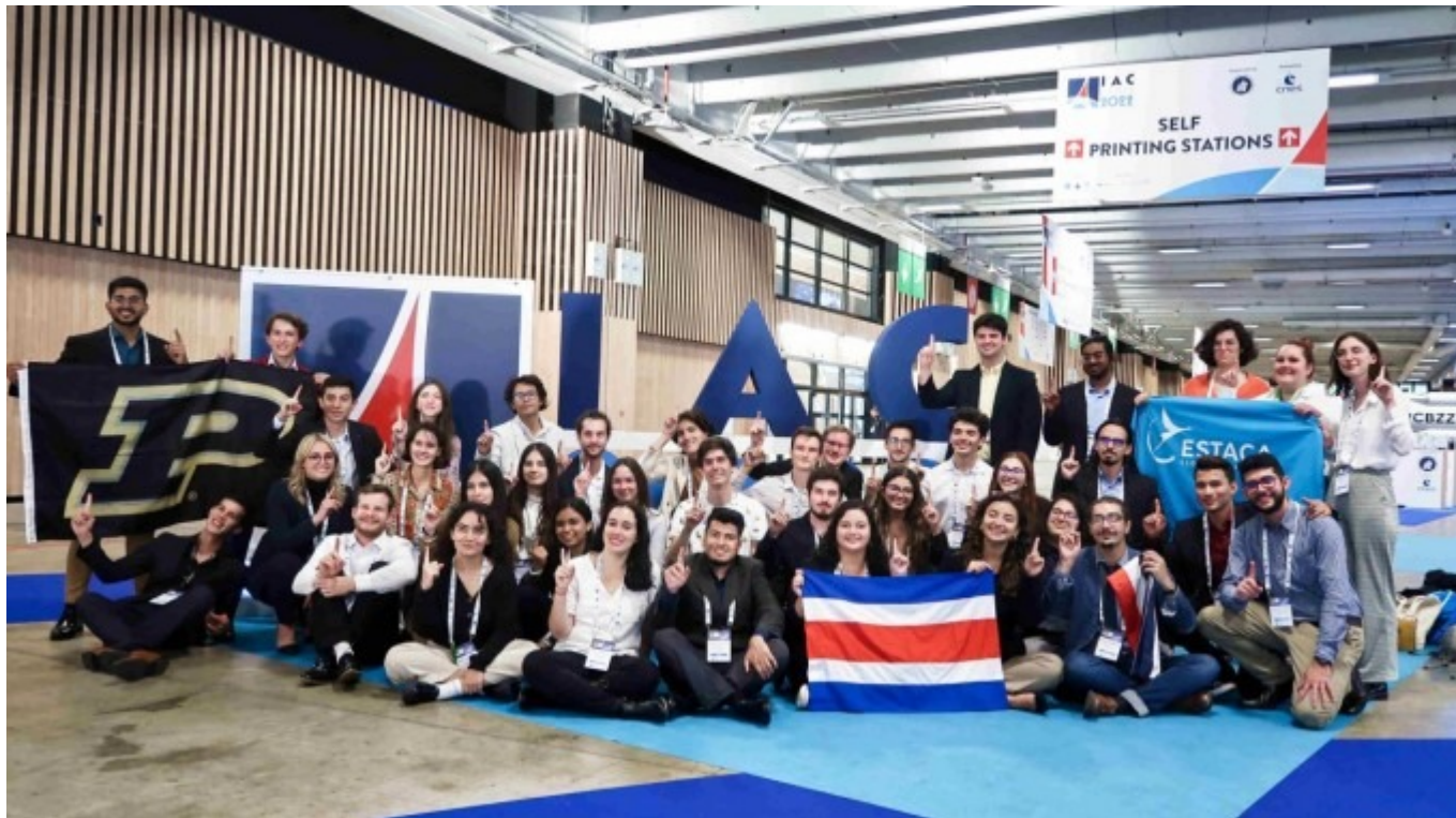
44 estudiantes del Proyecto Polaris participaron en el Congreso Internacional de Astronáutica (IAC) 2022.