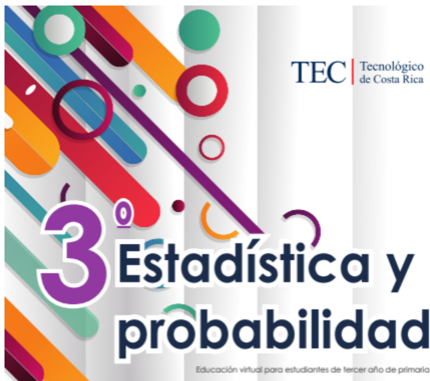
Portada del libro: Probabilidad y Estadística.