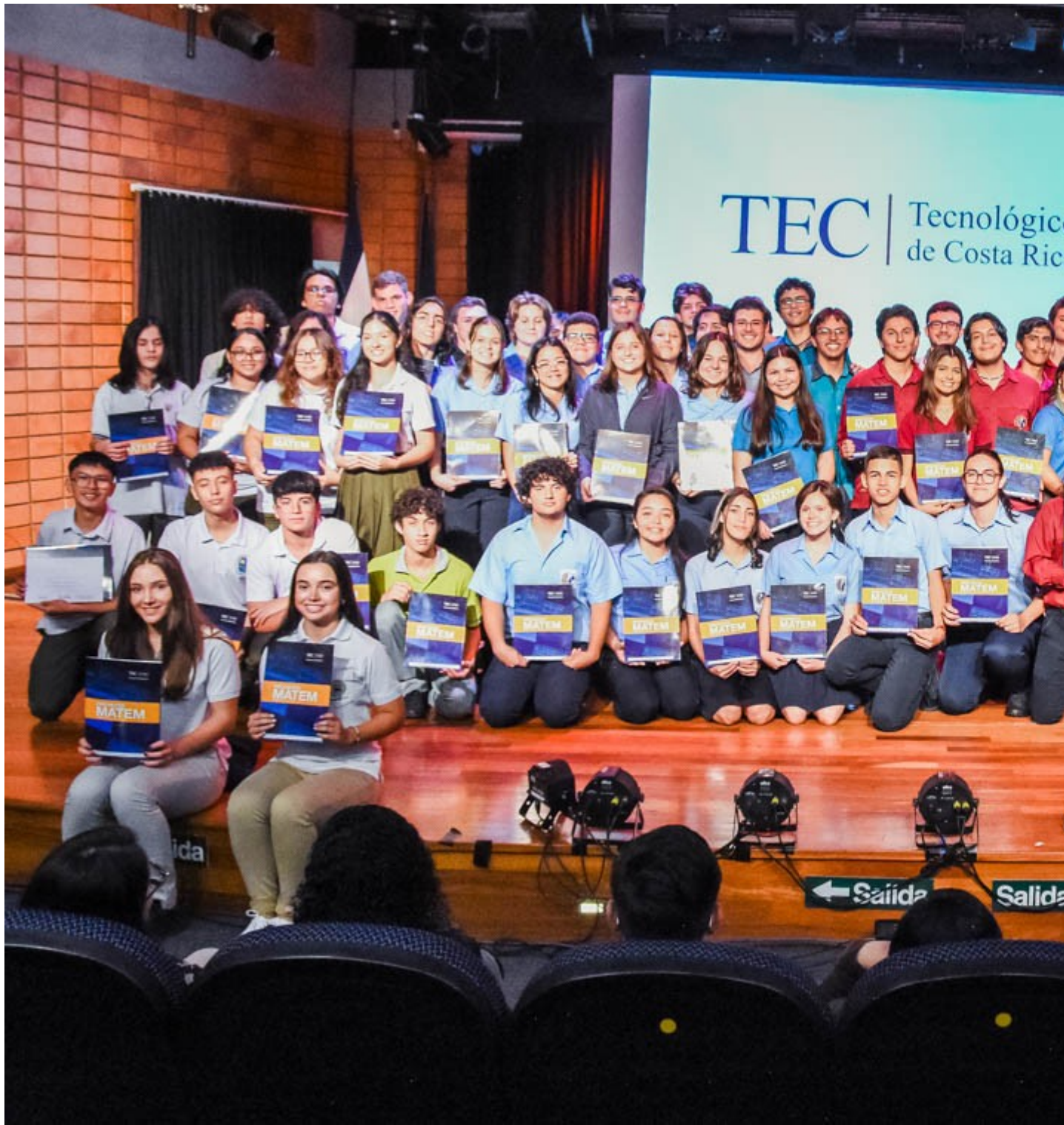
90 estudiantes de décimo y undécimo año de secundaria recibieron su certificado del

Dicho programa es coordinado por la Escuela de Matemática del TEC [3] y por otras universidades estatales. Nació como una alternativa para contribuir a mejorar la formación matemática de los estudiantes de secundaria.