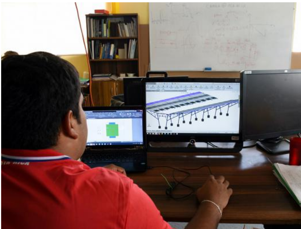
En el techo del parqueo del CTEC, en San Carlos, se colocarán tres tipos de módulos

“Los módulos fotovoltaicos responden de forma distinta a las condiciones climáticas, porque los rayos solares cuando pasan por las nubes lo que hacen es que filtran ciertos componentes del espectro electromagnético de la radiación solar, entonces eso hace que unos módulos generen más o menos electricidad. Luego, la temperatura los puede afectar en mayor o menor medida. Todo eso lo vamos a analizar y corroborarlo de forma práctica y vamos a determinar cuál es el módulo adecuado para esa zona”, explica el experto.